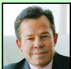
詹姆斯·萊丁格 總裁兼首席執行長