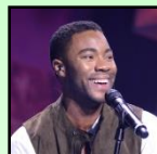
杜安·麥克羅夫林 演員/歌手和 愛的奇蹟創辦人