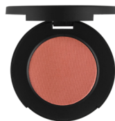
La La 礦物胭脂