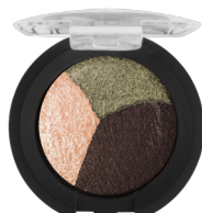
礦物烘焙雙效 眼影組合