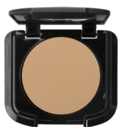
無瑕美肌兩用粉餅

獨特的掃頭形狀讓你輕鬆沿顴骨、髮線和下巴掃上產品。輕輕按壓則可提升碎粉和粉餅的遮瑕度。