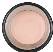
無瑕美肌眼部底霜