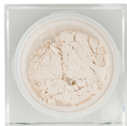
無瑕美肌透亮碎粉