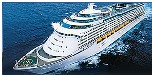
海洋航行者號 Voyager of the Seas

有關之價錢以9月13日基本的內艙房計算,有關之訂位情況需按報名當天為準,個別郵輪艙房不同而價格有所差別。詳情請與本公司職員查詢。