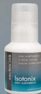
愛尚它®強鈣配方粉末