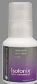
愛尚它®葡萄籽、松樹皮、紅酒萃取精華粉末