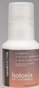
愛尚它®綜合礦物質