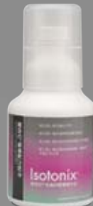
愛尚它®莓果配方粉末