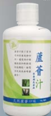
蘆薈汁(天然蘆薈口味)