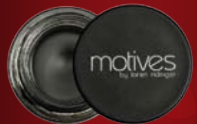
大膽搶眼的貓眼妝效