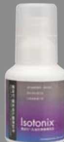
愛尚它®益生消化酵素粉末