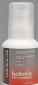
愛尚它®複方維生素B粉末