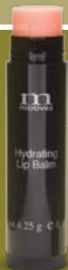
莫蒂高保濕潤唇膏 T0153 NT$590