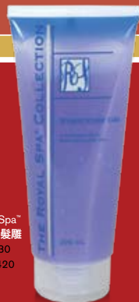
Royal Spa™ 造型護髮霜 T7130 NT$420