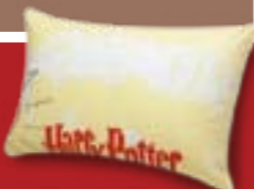
Harry Potter (學院哈利) 舒眠枕【康活購物網】NT$499