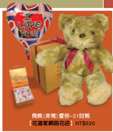
飛熊(非常)愛你-21吋熊【花道家網路花店】NT$520