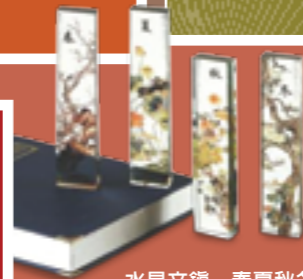
水晶文鎮-春夏秋冬【上亞禮品批發商城】NT$600