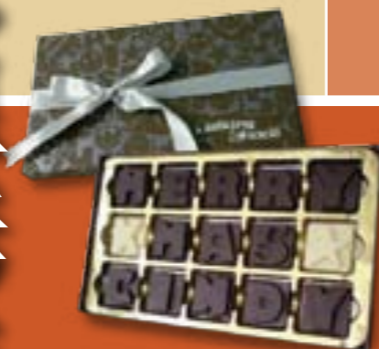
DIY字母巧克力禮盒【Talking Choco字母巧克力】NT$580