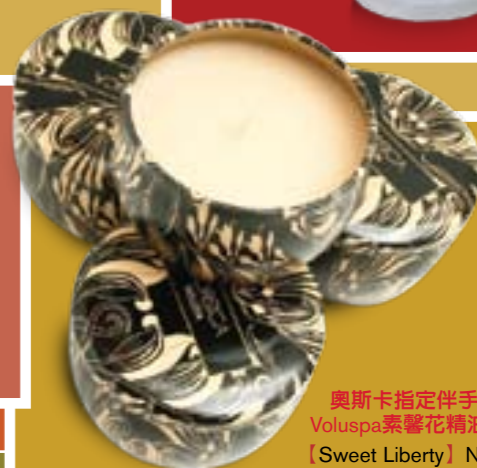
奧斯卡指定伴手禮-Voluspa素馨花精油蠟燭【Sweet Liberty】NT$599