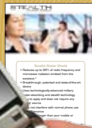
雷達波輻射防護片 T16006 NT$420