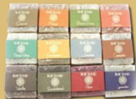
Bali soap手工有機皂(全套體驗組)【Wala哇啦購物網】NT$640