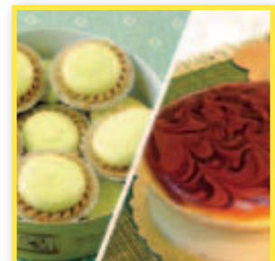
味覺系烘焙坊 業績獎勵6%現金回饋6% 特色商品推薦：水果乳酪塔、多穀糧巧酥