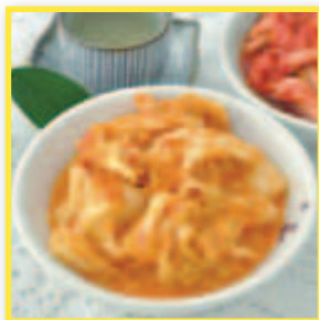
桂花品東西 業績獎勵7%現金回饋8% 特色商品推薦：桂花釀、黃金泡菜