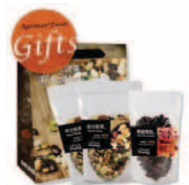
綠食集 業績獎勵5%現金回饋5% 特色商品推薦：綜合堅果、蔓越莓乾