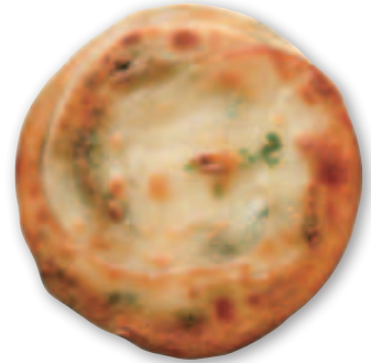
慕鈺華三星蔥油餅 業績獎勵7%現金回饋8% 特色商品推薦：三星蔥油餅、韭菜水餃