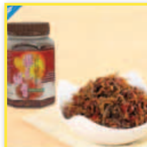
宏嘉食品行 業績獎勵5%現金回饋5% 特色商品推薦：櫻花蝦醬、抹茶紅豆蛋糕