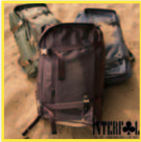
INTERFOOL潮流背包 業績獎勵5%現金回饋5% 特色商品推薦：Main Line系列/高密度尼龍雙肩後背包/防水雙肩電腦後背包

美安台灣經銷商夥伴及優惠顧客，盡情享受購物的樂趣，網路夥伴商店提供的諸多好康好禮。立刻賺取2%到33%的現金回饋，這麼好的購物計畫，盡在美安台灣公司的網路夥伴商店！