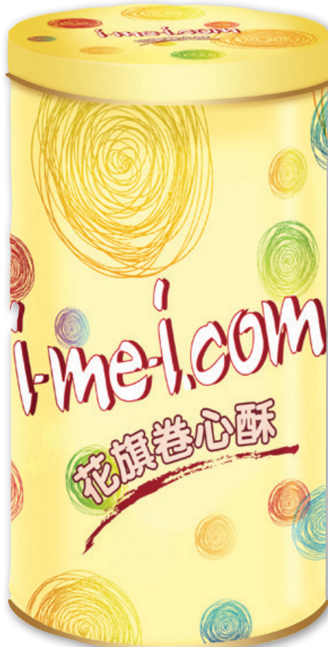
義美聯合商城 業績獎勵5%現金回饋5% 特色商品推薦：花旗卷心酥、義美熟香腸（原味、蒜味）