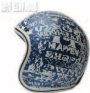
魔頭帽騎士用品網路商店 業績獎勵5%現金回饋5% 特色商品推薦：騎士安全帽、機車用品