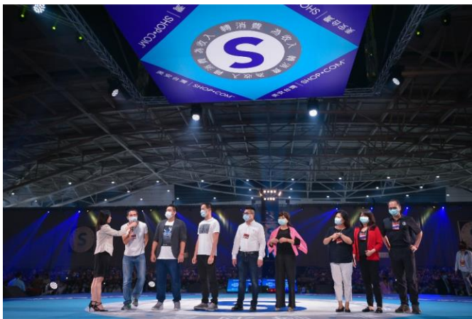
執行高級顧問經理級