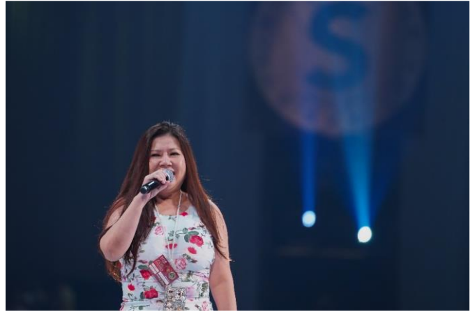
資深執行副總裁級