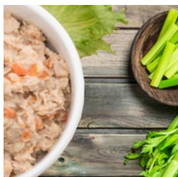
下午小食 吞拿魚釀西芹條