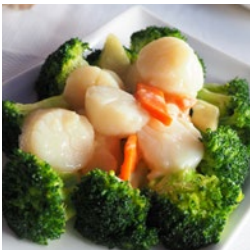
午餐 西蘭花炒帶子