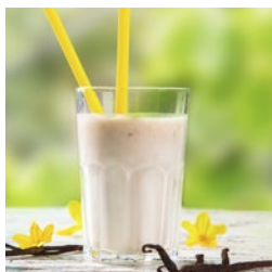
運動後 高纖蛋白營養飲品