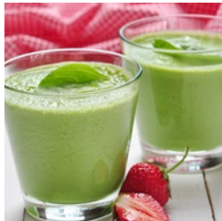
上午小食 士多啤梨菠菜奶昔